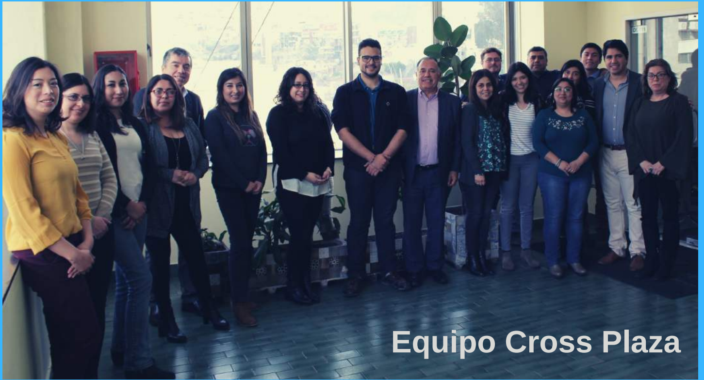
Equipo Cross Plaza